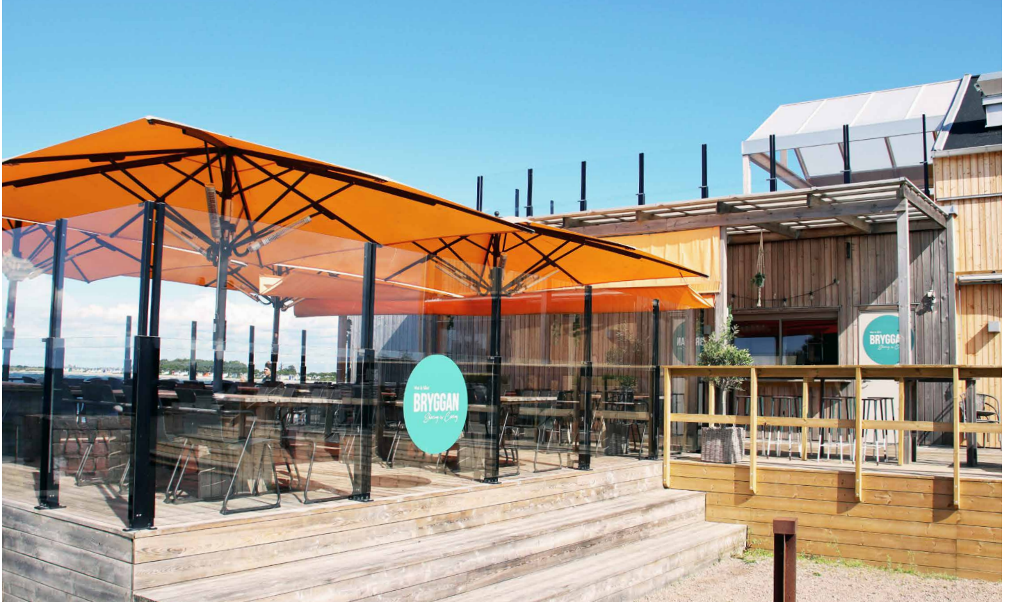
Skanör Falsterbo Kallbadhus & Bryggan, Skanörs Hamn

Må ikke monteres der det er fare for fall