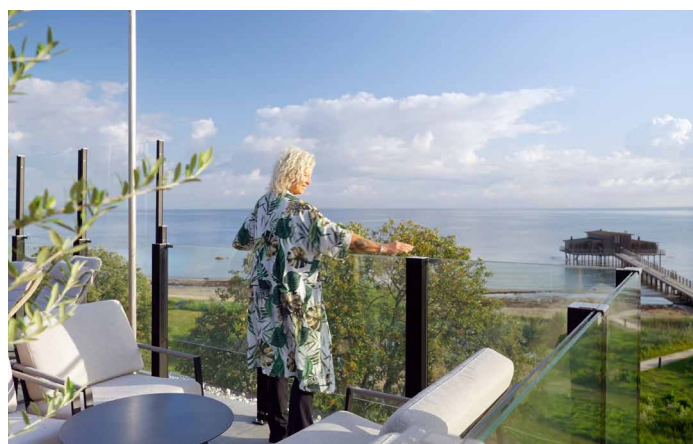
Rooftop, Hotel Skansen, Båstad